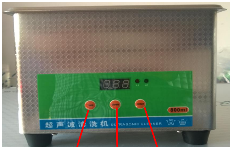
时间设置 开关 复位